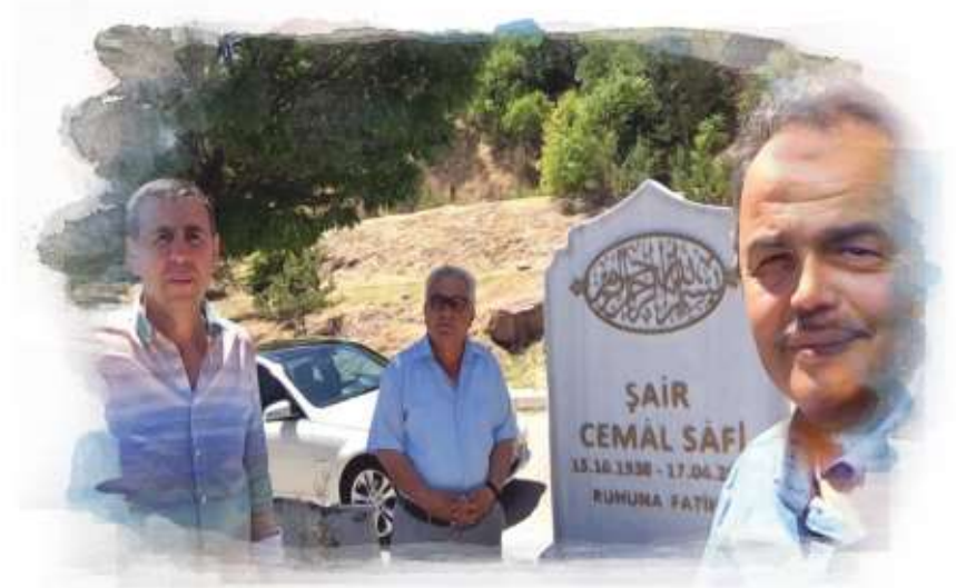
Sağlığında sık sık bir araya geldiği vefalı dostlar, ebedi uykusuna yatan Üstad Cemal Safi'yi kabrinde de yalnız bırakmıyorlar.

Ahmet Haşim ile başlayan yazıyı yine onun bir sözü ile sona erdirelim: “En güzel şiirler mânâlarını kâriin (okurun) ruhundan alan şiirlerdir.” Cemal Safi, sevgiliyi siygaya çeken, kendi onurunu koruyan -ve bestelenen- şiirleri dahil, her okunduğunda okurlarının ruhuna hitap etmeye devam edecek bir şiir evreninin kutlu-bahtlı şairidir.